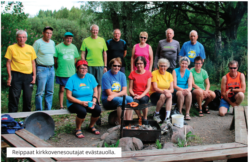
Reippaat kirkkovenesoutajat evästauolla.