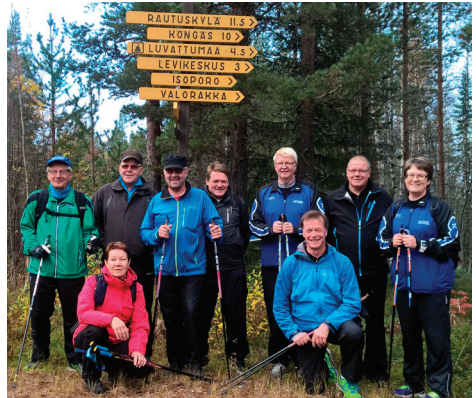
Iloiset ruskaretkeläiset Levin maisemissa.