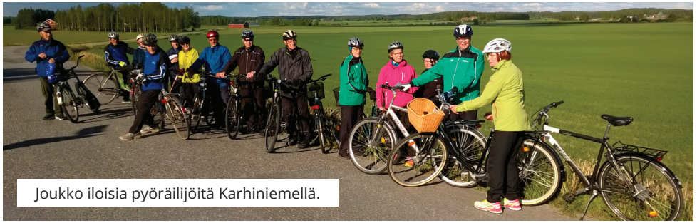
Joukko iloisia pyöräilijöitä Karhiniemellä.